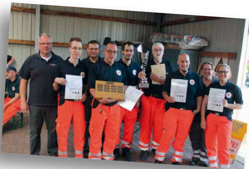
Unser Siegerteam vom Ortsverein in Unna.

Z um alljährlichen Leistungsvergleich der Rotkreuzler aus dem gesamten Kreisgebiet fanden sich auch in diesem Jahr wieder haupt- und ehrenamtliche Kollegen und Mitglieder ein. Im Kreisrotkreuzwettbewerb traten die Mitglieder unserer Ortsvereine in verschiedenen Disziplinen dieses Mal in Werne gegeneinander an und bewiesen den Ausbildungsstand der Einsatzkräfte und ihre Leistungsfähigkeit.